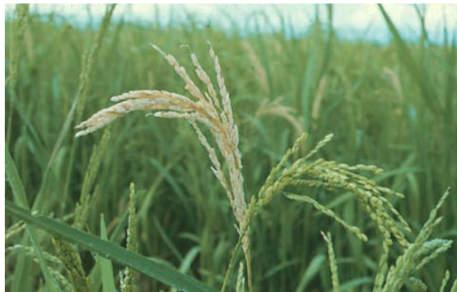
شکل ۵- علائم Whiteheads ایجاد شده توسط کرم ساقه خوار نواری برنج

۳- خسارت مرگ جوانه مرکزی: که همزمان با تغذیه لاروهای سنین مختلف نسل اول در زمین اصلی رخ می دهد. این علامت مربوط به زمانی است که لاروها وارد ساقه اصلی برنج شده و با تغذیه از بافت درونی ساقه موجب زرد و خشک شدن آن خواهند شد. این علامت را به اصطلاح dead hearts گویند و در مرحله رویشی گیاه رخ می دهد.