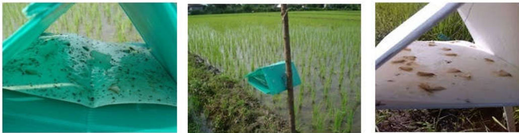
شکل ۷- نصب تله فرمونی دلتا

به منظور ردیابی آفت و تعیین زمان مناسب مبارزه از تله‌های دلتا (Delta trap) با کارت چسبنده به همراه فرمون استفاده می‌شود. این نوع از تله‌ها به فاصله ۷۰ متر از یکدیگر در مزرعه نصب می‌شود. تله‌ها از اوایل کشت برنج در مزرعه نصب شده و نمونه برداری دو بار در هفته تا آخرین شکار پروانه ادامه می‌یابد. چسب تله‌ها به دلیل خشک و غیر موثر شدن هر یک یا دو ماه و رهاسازها هر ۲۰ الی ۳۰ روز تعویض شوند. استفاده از تله‌های نوری یا فانوسی در مزارع برنج نیز در بررسی حضور و تعیین جمعیت آفت کاربرد دارد.