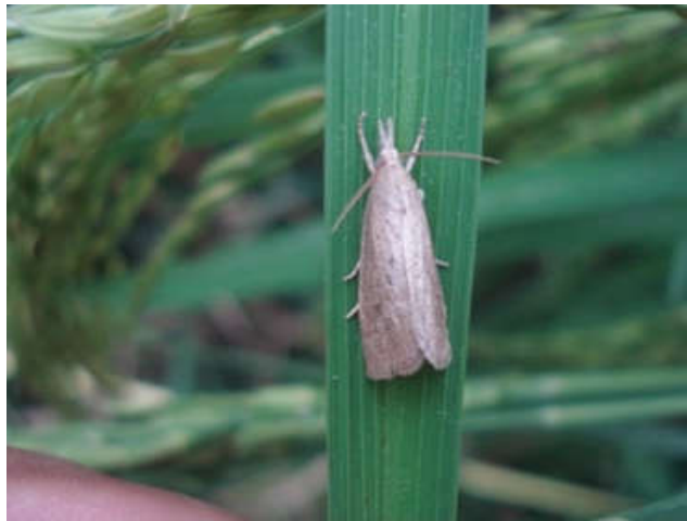
شکل ۲- حشره کامل کرم ساقه خوار نواری برنج