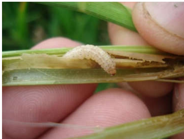
شکل ۳- کرم ساقه خوار نواری برنج