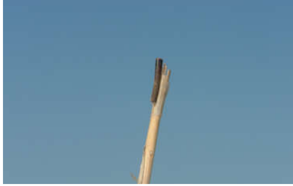
شکل ۸- رهاسازهای فرمونی اختلال در جفت‌گیری