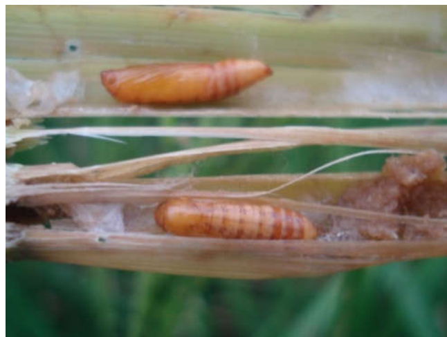
شکل ۴- شفیره کرم ساقه خوار نواری برنج