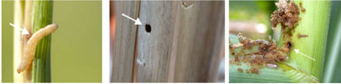
شکل ۶- سوراخ ایجاد شده روی ساقه برنج توسط کرم ساقه خوار